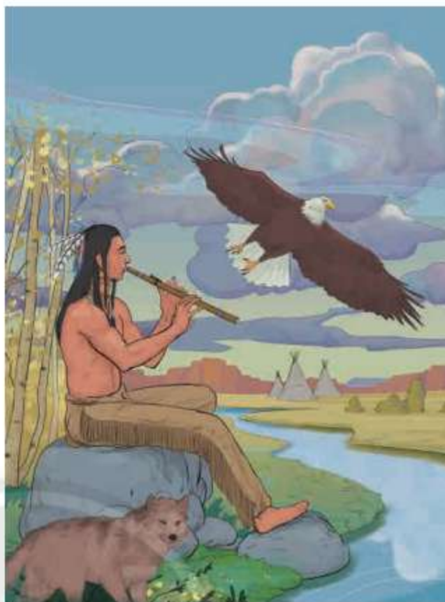
Người da đỏ sống hoà hợp, gắn bó với thiên nhiên

Ở thành phố của người da trắng, chẳng có nơi nào là yên tĩnh cả, chẳng có nơi nào là nghe được tiếng lá cây lay động vào mùa xuân hay tiếng vỗ cánh của côn trùng. Nếu có nghe thấy thì đó cũng là những tiếng ồn ào lảng mạt 1 trong tai. Và cái gì sẽ xảy ra đối với cuộc sống, nếu con người không nghe được âm thanh lẻ loi của chú chim đớp mồi hay tiếng tranh cãi của những chú ếch ban đêm bên hồ? Tôi là người da đỏ, tôi thật không hiểu nổi điều đó. Người Anh-điêng 2 chúng tôi ưa những âm thanh êm ái của những cơn gió thoảng qua trên mặt hồ, được mưa gội rửa và thấm đượm hương thơm của phấn thông.