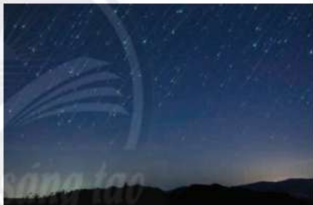
Một cơn mưa sao băng

– Mưa sao băng Ô-ri-ơ-nít (Orionids): 2/10 – 7/11 hằng năm, cực điểm vào 21 – 22/10.